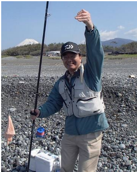
スーさん、これからは「Mr.Sundowner」と呼ぼう…

森もっちゃんもポツポツとキスを拾っている様子。トキ姐さんとは言う、何やらオヤツを沢山持ち込んで皆に「これ食べや！」と半ば押し売り状態で各自のクーラーのサイドボックスに、どんどん投げ込んでます。各自色々な楽しみ方で富士山の下で釣りを楽しみました。黒い竿は、2番節にガイド2個と言うメーカーのセッティングとは違う仕様で、試投会で振った物とは一味違う仕上がりがりでした。この竿は買いですか（しかしガイドラッピングが難しそうな竿ですな）