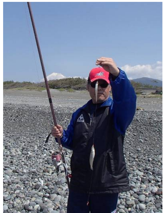
森もっちゃんも富士を背に…決まっていますなあ