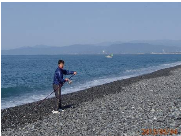
浩太君、クラブ対抗頼みませ！！

森もっちゃんもポツポツとキスを拾っている様子。トキ姐さんとは言う、何やらオヤツを沢山持ち込んで皆に「これ食べや！」と半ば押し売り状態で各自のクーラーのサイドボックスに、どんどん投げ込んでます。各自色々な楽しみ方で富士山の下で釣りを楽しみました。黒い竿は、2番節にガイド2個と言うメーカーのセッティングとは違う仕様で、試投会で振った物とは一味違う仕上がりがりでした。この竿は買いですか（しかしガイドラッピングが難しそうな竿ですな）