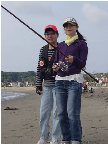
ゲストさんにアドバイスの和子ママ

「これではシーガルの理念に反する」ということで仕掛けを外し投練タイムに突入。10投ほどすると何とかまともに投げられるようになりました。